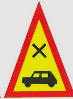
uwaga, skrzyżowanie z drogą