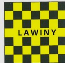
niebezpieczeń- stwo lawin