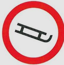
zakaz jazdy na sankach