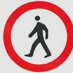
zakaz przejścia dla pieszych