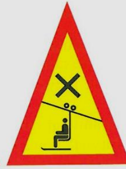
uwaga, skrzyżowanie z wyciągiem