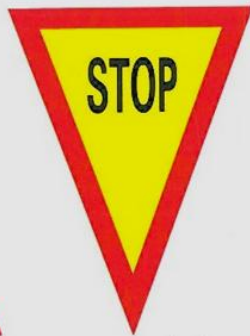
zatrzymać się, przeszkoda na szlaku