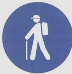
szlak dla pieszych