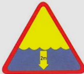
niebezpieczna głębokość wody